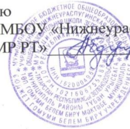
График проведения оценочных процедур по МБОУ «Нижеураспугинская ООШ ЗМР РТ» на I полугодие 2021-2022 учебного года